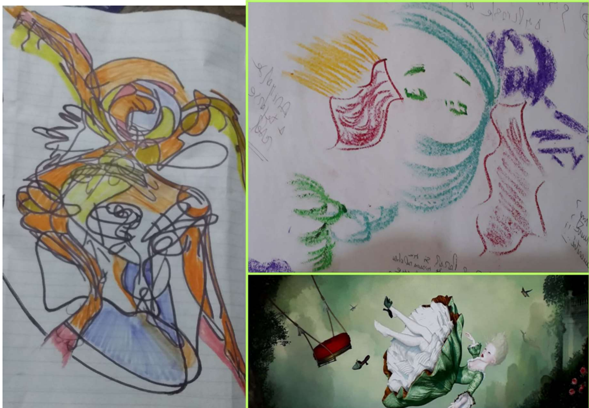
Producciones libres de las participantes e imagen con la que se trabajó en el encuentro 4.

social (Le Breton, 1995; Panhofer, 2005; Bardet, 2018; Guido, 2016), del vínculo como multiplicador de potencias individuales (Deleuze, 2001), y de lo grupal como pantalla de proyecciones (Fernandez, 1989). Desplegando un poco más estas ideas podríamos agregar que este ser que entendemos como psique y soma entramado nos interesa desde su capacidad de afectación y potencia que le permite componerse con otras potencias en el encuentro (Deleuze, 2001), en el “acuerparnos”. La conversión en verbo del sustantivo “cuerpo” que toma forma en la idea del “acuerparnos”, forjada desde los movimientos de mujeres, cuestiona las binariedades mente - cuerpo, externo - interno, pasivo – activo (Federici, 2016). Sostenemos que desde el cuerpo tiene lugar un “sentí-pensar”, una forma de procesamiento subcortical de percepción a través del cuerpo vibrátil (Guattari & Rolnik, 2005) que requiere que nos comprendamos de manera integrada, en términos individuales –cuerpo-mente-emoción - pero también en términos de cuerpo colectivo.