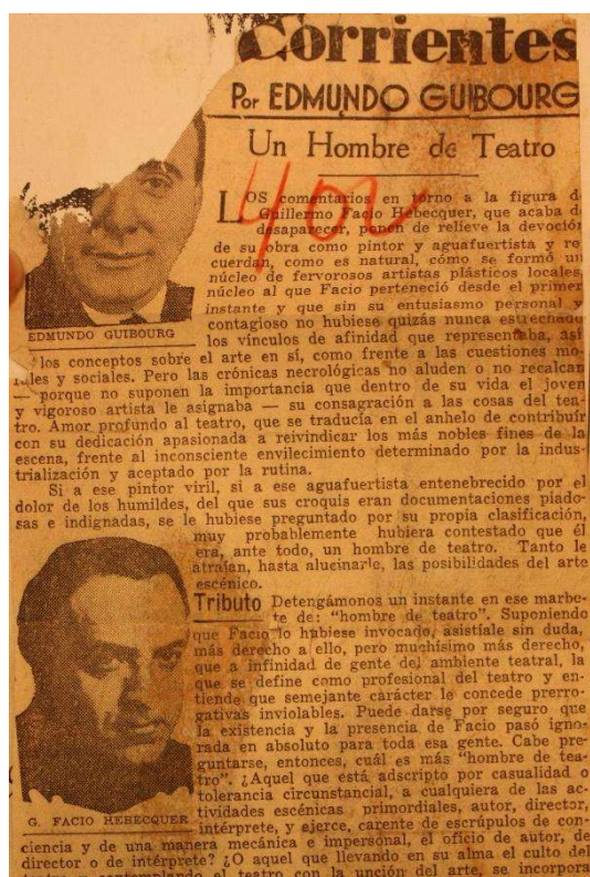
Figura 1. Recorte hemerográfico – Fondo Facio Hebequer - Museo Sívori

El descubrimiento de esta otra faceta de Facio Hebequer, como también la de polemista (escribió una gran cantidad de reseñas en diferentes publicaciones de izquierda), potenciaban la reflexión en torno a los cruces y articulaciones entre el arte, la política y la cultura de izquierdas, lo que provocó un desvío en mi investigación al decidir seguir aquellas huellas y dedicar una investigación a esta figura intelectual. Entre los capítulos del libro ya mencionado (Devés, 2020), hay uno (capítulo 3) dedicado completamente a las primeras experiencias de los teatros independientes.