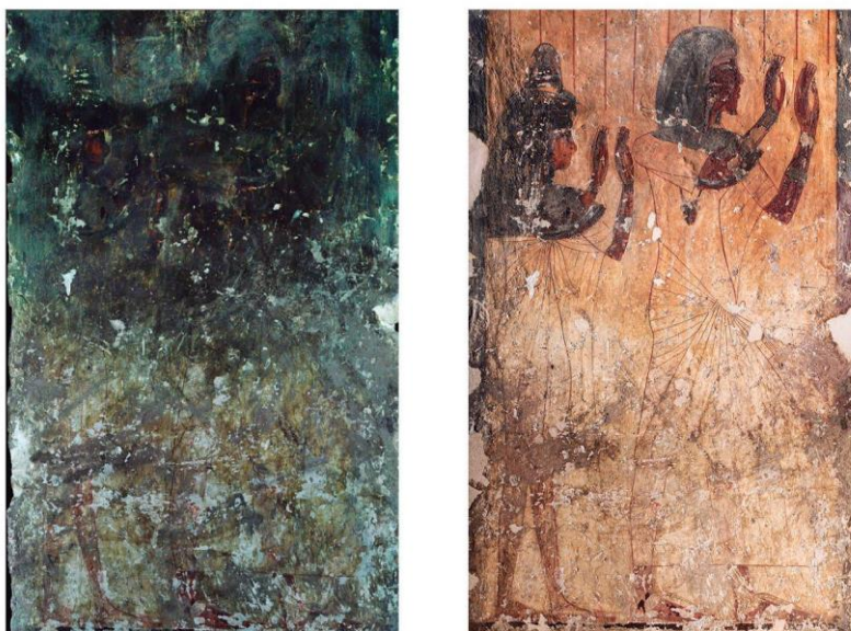
Figura 2. TT49. Registro superior de la cara oeste del pilar noroeste de la capilla de culto antes de su limpieza (izquierda) y luego de ella (derecha).

antes del láser se aplicaron solventes de rápida evaporación con un papel tissue fino durante un corto tiempo. La acción combinada permitió obtener muy buenos resultados.