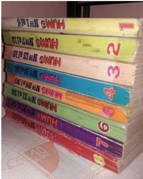
Imagen 2. Humor para coleccionar (1980) (Fotografía).