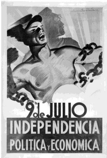
Figura 1. 9 de julio: independencia política y económica, Tellez, A. (diseñador), Subsecretaría de Informaciones de la Nación, Dirección General de Difusión. Buenos Aires: Departamento fotográfico del Archivo General de la Nación, 1947, N° de Inventario: 219990-C:2883