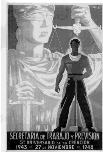
Figura 2. Secretaría de trabajo y previsión: 5to aniversario de su creación, Alfonsín, H. (diseñador), Subsecretaría de Informaciones de la Nación, Dirección General de Difusión. Buenos Aires: Departamento fotográfico del Archivo General de la Nación, 1948, N° de Inventario: 218998-C:2883