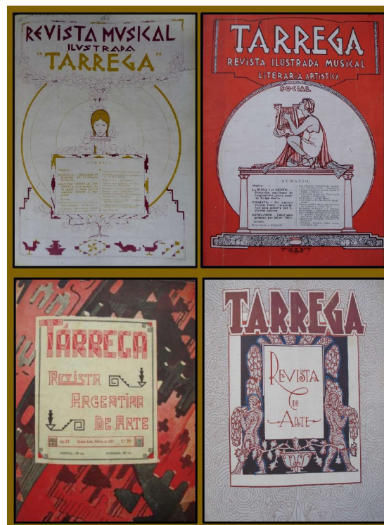
Figura 1. Algunas tapas de la revista Tárrega a lo largo de su aparición