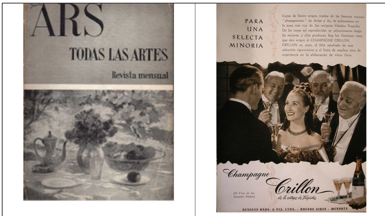
Figura 3. "Todas las artes". Figura 4. Publicidad dirigida a franjas sociales de buen poder adquisitivo

Considerando que el acontecer musical de la Argentina comprende tanto la creación como la circulación de repertorios, un aspecto de interés en la revista Ars fue su dedicación tanto a figuras de la música local como extranjera. Héctor Berlioz, Giacomo Puccini, Joseph Haydn, Felix Mendelssohn, Claudio Monteverdi, Claude Debussy, entre otros compositores de la historia musical europea de un amplio arco temporal, tuvieron su número especial en la revista. En el número dedicado a Antonio Vivaldi, por caso, se incluyó un facsímil de la partitura del Concierto a cinco en Re Mayor : la finalidad de constituirse como un aporte pedagógico queda en evidencia.