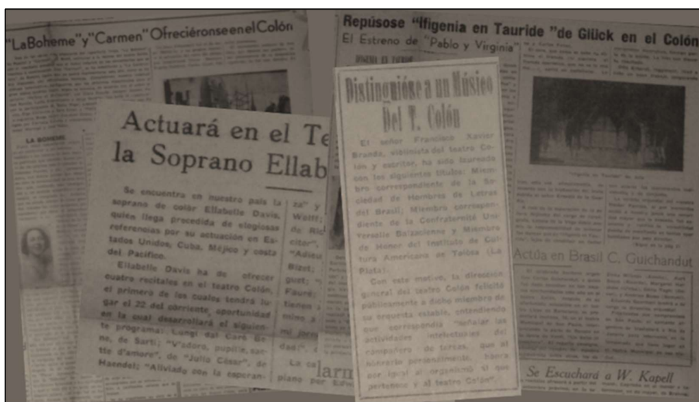
Figura 2. Buenos Aires Musical, varios números de 1946

Como ya mencionara, la portada de la publicación se caracteriza por una columna de opinión firmada como “Buenos Aires musical” o sus iniciales “BAM” a forma de editorial. Durante el primer año, esta sección se ocupó de abordar la inequidad en el acceso a la música. En la columna del número 7 se listan la difusión en general y de la música nacional, los precios, los institutos de formación y la cantidad de conciertos en todo el territorio nacional, mientras que en los números 9 y 11 se ocupan de la creación de orquestas estatales (municipal, actualmente Orquesta filarmónica de Buenos Aires, y nacional, Orquesta Sinfónica Nacional, respectivamente). En el número 12 se expone sobre el horario vespertino de algunas funciones y el número 13 retoma la temática educativa. Son sus ejes en todos los casos la imposibilidad de ampliar el público así sea por la escasa o nula oferta en cada aspecto analizado en una ciudad signada por el empleo industrial, comercial y de servicios con sus propias características laborales.