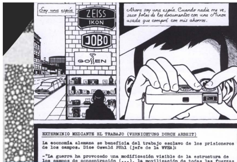
Figura 2. "Soy una espía". Fuente: Ignacio Minaverry (2009).