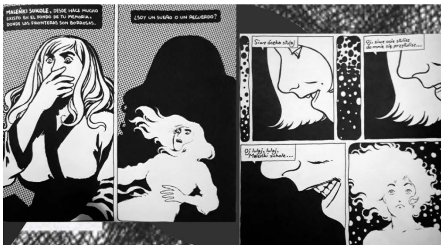
Figura 6. Canción de cuna. Fuente: Ignacio Minaverri (2018).

La ambigüedad de la palabra encierra una imagen violenta y terrible dentro de una canción de cuna que debería de ser un elemento tranquilizador en la infancia. Elementos como este nos adelantan que detrás de estas escenas hay otro sentido, un revés siniestro. En Dora: Malenki sukole la canción de cuna se cuele en las viñetas, configurando una irrupción extraña y familiar a la vez. Al principio no hay pistas para saber qué significa, pero el enunciado aparece reiteradamente como un aviso de la revelación del origen de Lotte (véase figura 6). Podemos pensar paralelamente en estas canciones de cuna como irrupciones: en Wörterbuch , de lo siniestro y violento; en la historieta de Minaverri, de la voz de la madre, lo familiar y la lengua materna. En ambos casos, las canciones se constituyen como un sonido palpitante, que irrumpe desde esa ruptura de la identidad de Lotte y la niña protagonista de Wörterbuch .