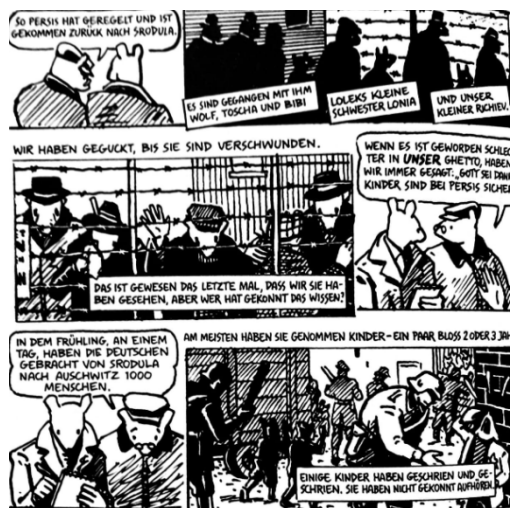
Figura 3. Maus. Fuente: Art Spiegelman (2008 [1991]).