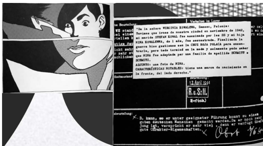
Figura 4. Archivo de Lotte.

En estas mismas líneas podemos abordar Wörterbuch , donde la autora contextualiza su ficción en la memoria traumática de la última dictadura militar argentina. Esta operación plantea una dificultad respecto a su posicionamiento dentro del repertorio de novelas sobre esta temática, que indudablemente encierra dinámicas discursivas y políticas muy complejas. Contrario al caso de las acciones de la Lebensborn , los crímenes de la última dictadura militar argentina siguen muy presentes en el ámbito político. Aún hoy se siguen descubriendo las identidades de nietos desaparecidos y apropiados por los militares genocidas. Por estas razones, las obras sobre esta temática tienden a formar parte de un proyecto político nacional o son parte de la historia familiar del autor o autora, por lo cual están habilitadas para hablar sobre el tema. Sin embargo, Jenny Erpenbeck decide utilizar este contexto para hablar sobre la ruptura de identidad, la infancia y la adquisición del lenguaje. Me parece válido pensar en este sentido en términos de memorias colectivas y memorias individuales como enfoque a la hora de analizar estas obras.