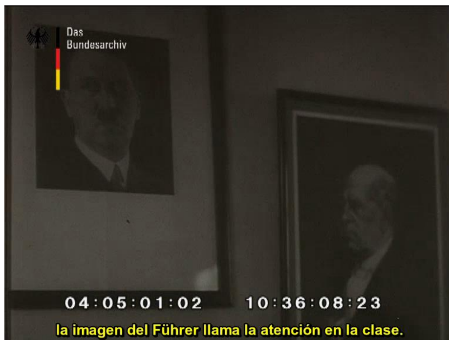
Imagen 4. El cuadro de Adolfo Hitler es exhibido en una escuela alemana en el centro y por encima de los de Domingo Faustino Sarmiento y José de San Martín.