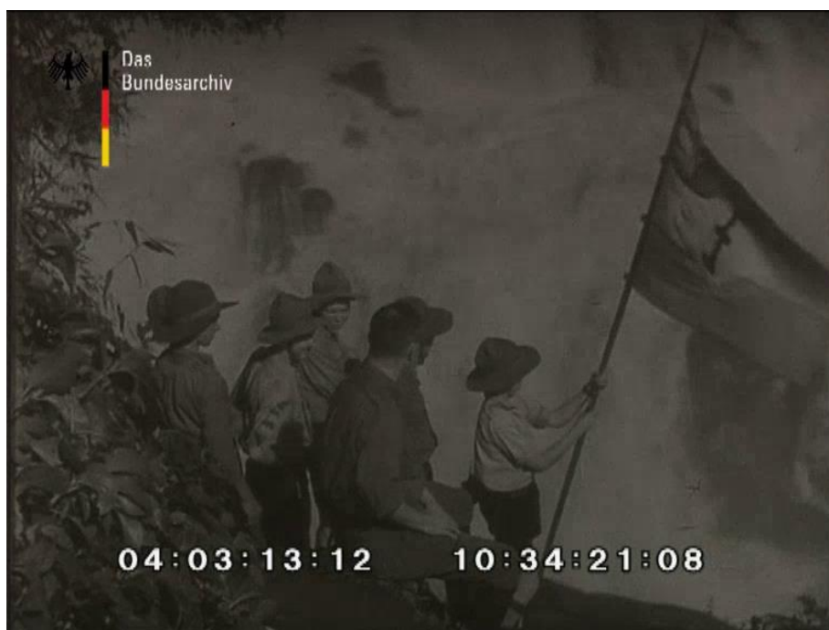
Imagen 3. Niños argentinos descendientes de alemanes alzan la bandera de las Hitlerjugend en las Cataratas del Iguazú.