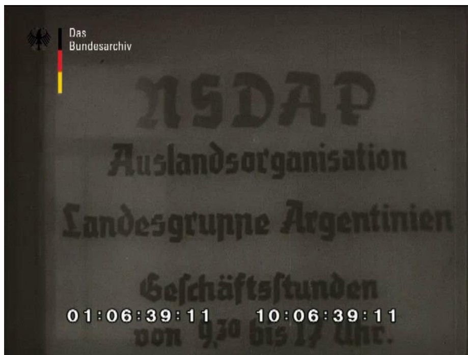
Imagen 2. Imagen de la entrada de la oficina del Landesgruppe Argentinien de la Auslandorganisation del NSDAP.