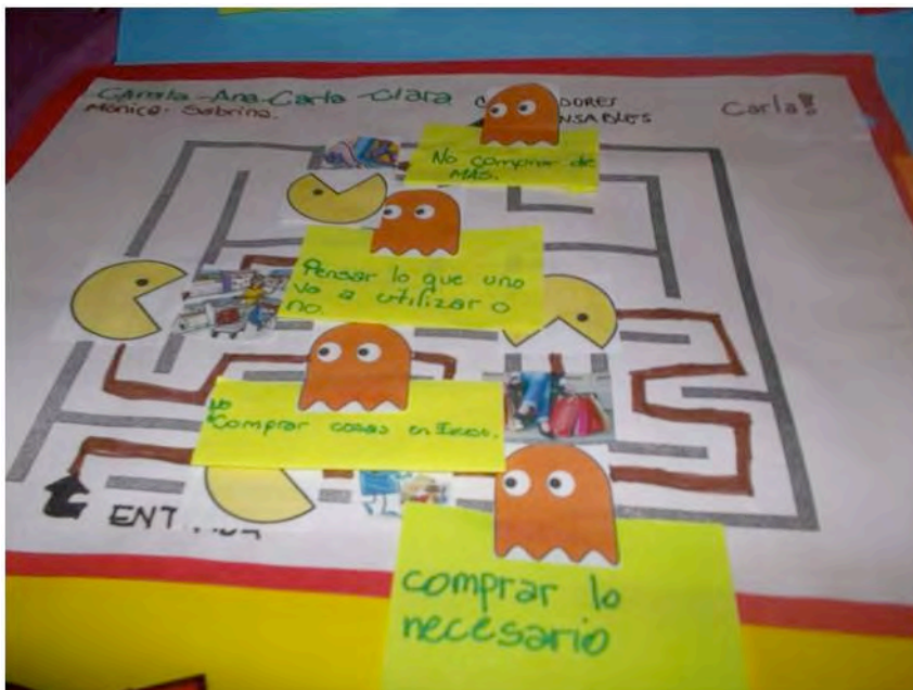
Actividad de cierre. Tema Sociedad de Consumo. Alumnos de 5° Esc. Carmen Vera Arenas UNCuyo Mendoza (capital) (octubre 2012)