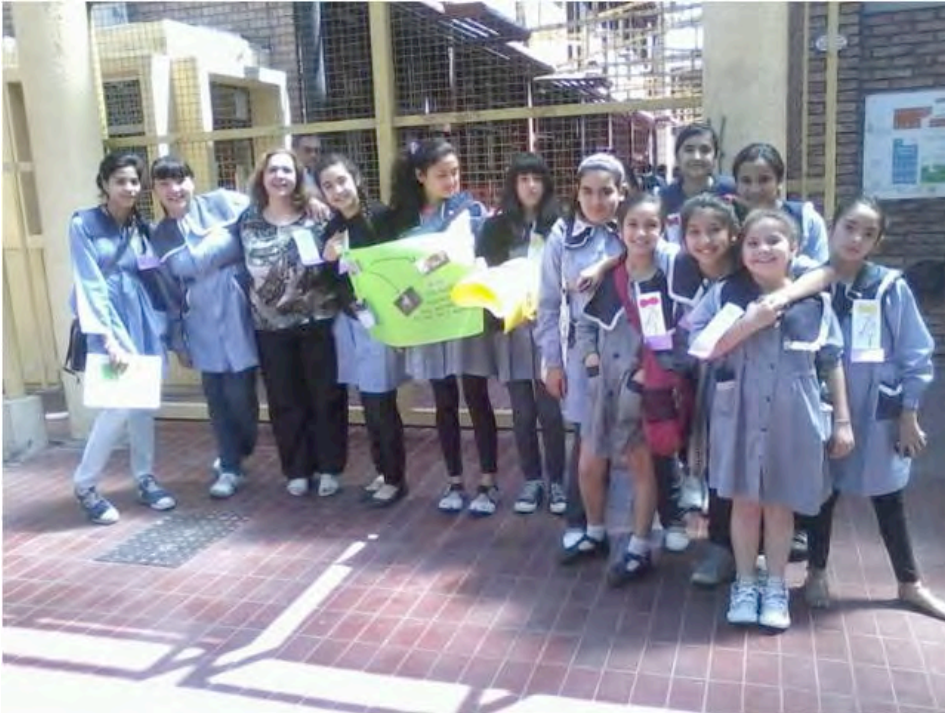
Alumnas de la Esc Ricardo Rojas (Mendoza Capital) al terminar el Encuentro de Filosofía con Niños, en la Fac. de Educación Elemental y Especial UNCuyo (noviembre 2012)