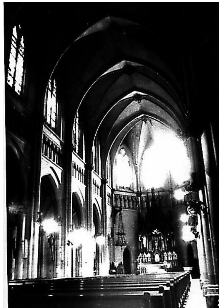
Buenos Aires. Acta bendición de la piedra fundamental Iglesia Colegio San Agustín. 12/10/1907